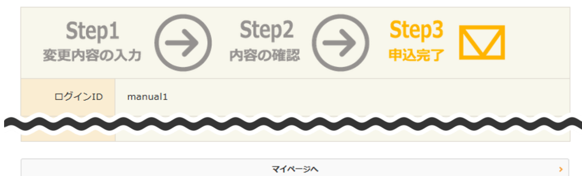
図 21：利用者情報変更（完了）画面