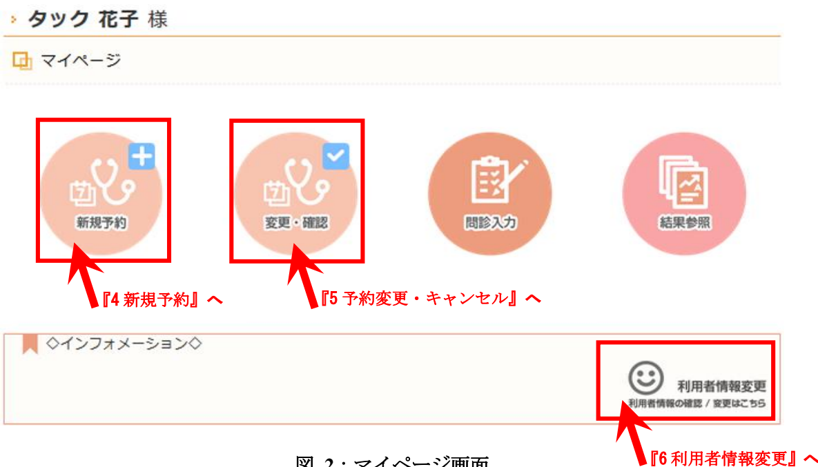
図 2 : マイページ画面