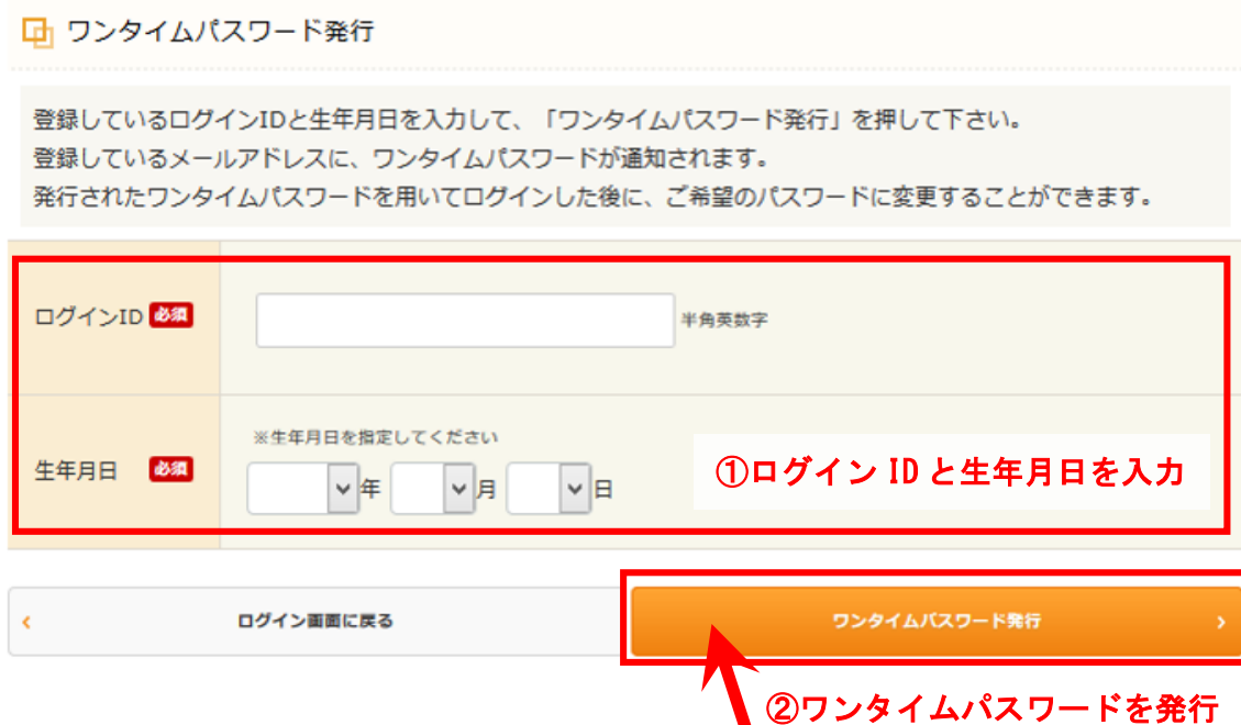
図 22 : ワンタイムパスワード発行画面

本人確認のため、ワンタイムパスワードによる認証を行います。ログイン ID と生年月日を入力して、「ワンタイムパスワード発行」をクリックしてください。