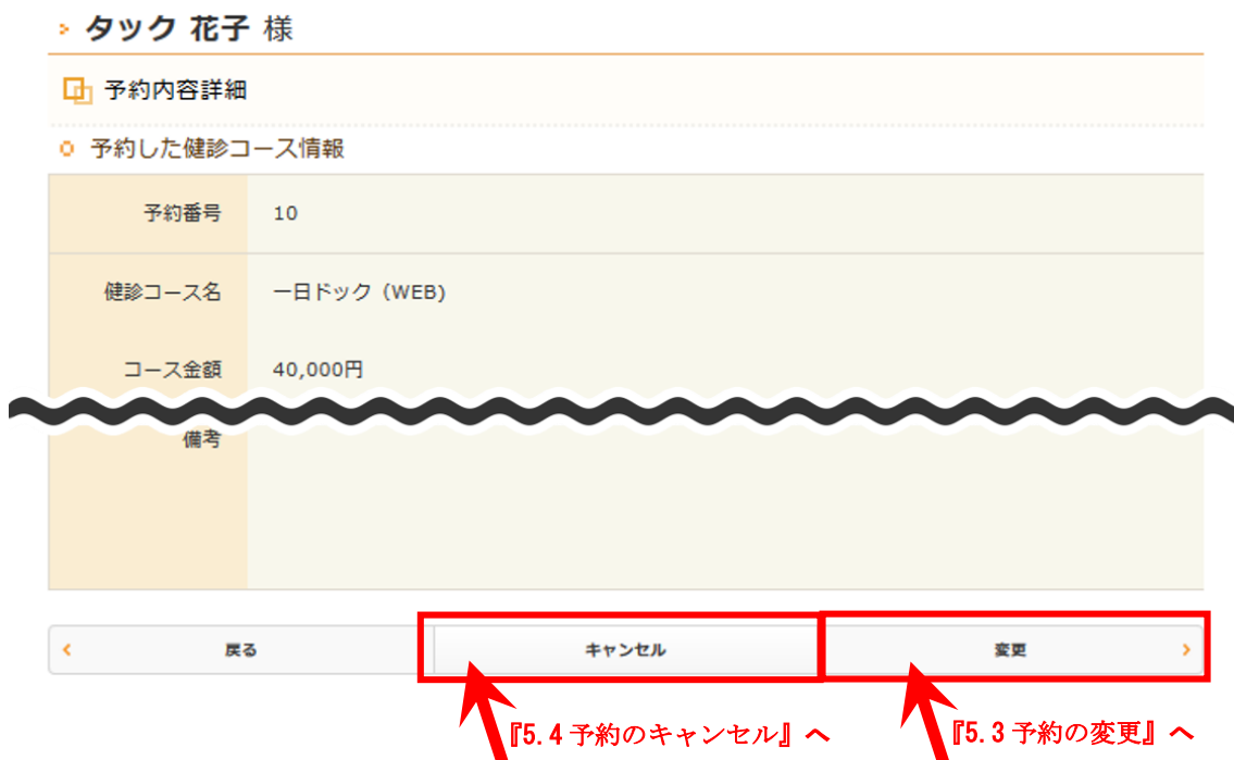
図 12：予約内容詳細画面