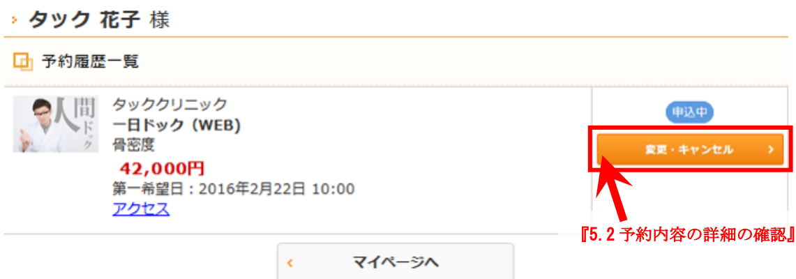
図 11：予約履歴一覧画面

ここでは、予約履歴を確認できます。予約中の内容の詳細を確認される方、あるいは、予約の変更申し込みや予約のキャンセルをされる方は、「変更・キャンセル」をクリックしてください。予約内容詳細画面が表示されるため、次の『5.2 予約内容の詳細の確認』を参照してください。