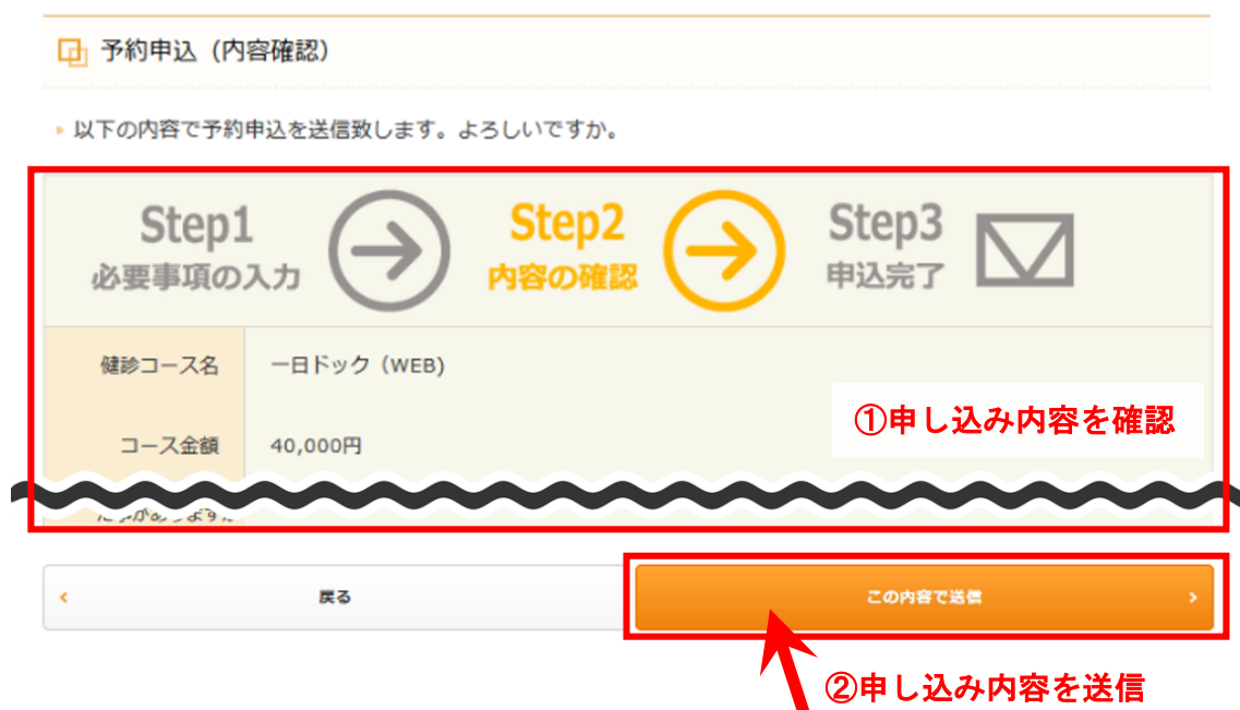
図 9 : 予約申込 (内容確認) 画面

入力内容に誤りがないことを確認した上で、「この内容で送信」をクリックしてください。予約の申し込みが施設に送信されます。