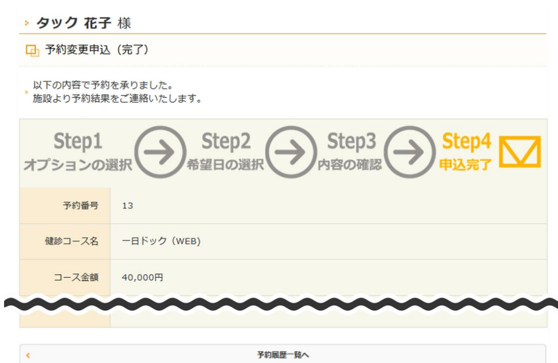
図 16 : 予約変更申込 (完了) 画面