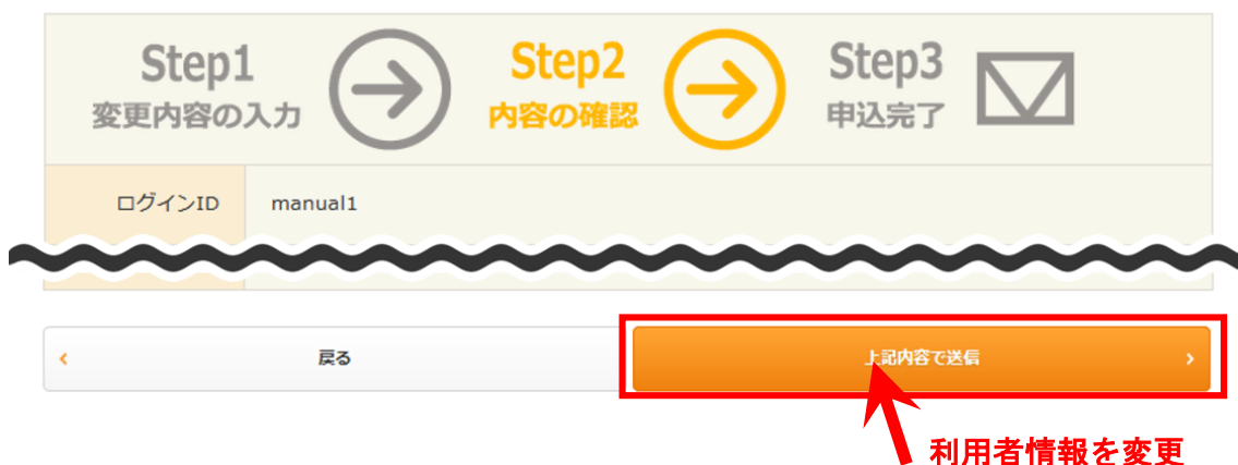
図 20：利用者情報変更（内容確認）画面