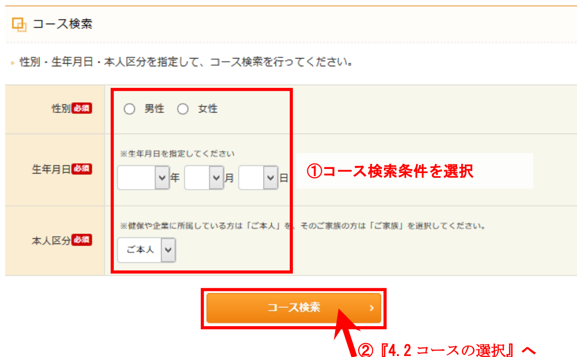
図 3 : コース検索画面