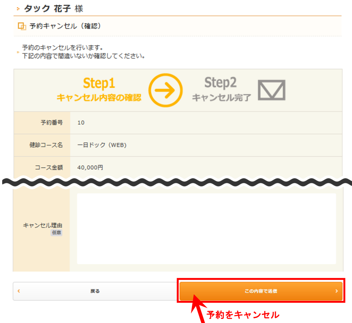
図 17：予約キャンセル（確認）画面

ここでは、キャンセルする予約の内容を再度確認できます。キャンセルを希望する予約であることを確認した上で、「この内容で送信」をクリックしてください。予約がキャンセルされます。